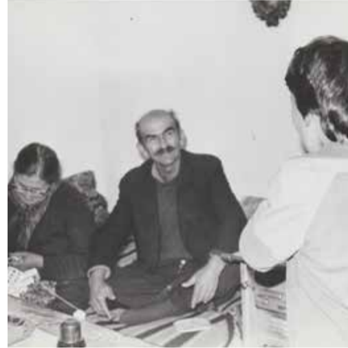
Ma famille et moi Η ΟΙΚΟΓΕΝΕΙΑ ΜΟΥ ΚΑΙ ΕΓΩ (1986)

Προβολές 2 ταινιών της και συζήτηση παρουσία της ίδιας