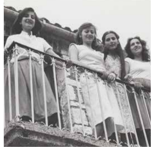
Au fil de l'aiguille ΚΟΚΚΙΝΗ ΚΛΩΣΤΗ ΔΕΜΕΝΗ (1982)