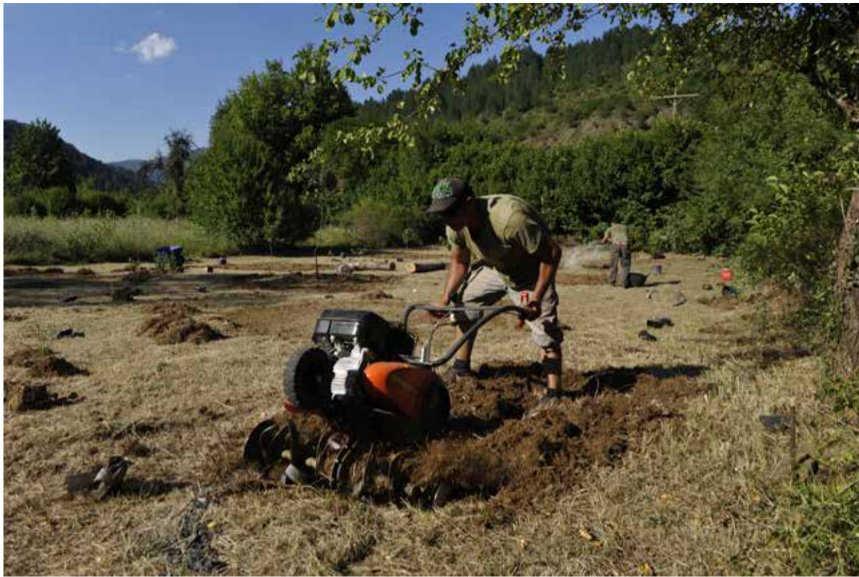
Ελάτε να δείτε τον κήπο μας! Ραντεβού στο STEKI την Πέμπτη 3/8, στις 19.30.