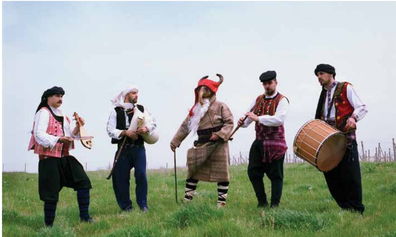
Η γκάντα, η λύρα, το καβάλι και το νταούλι!