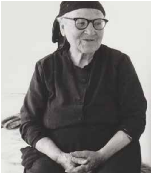
«Une vie dure... !» ΜΙΑ ΣΚΛΗΡΗ ΖΩΗ |