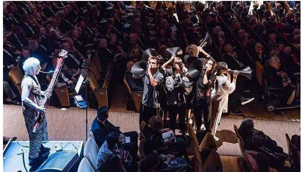
Πρόκειται για σόλο κομμάτια μέχρι συνθέσεις για 8 φωνές. Υπάρχουν κενά σε σχεδόν όλα τα ποιήματα της Σαφφούς- στιγμές όπου οι λέξεις της έχουν χαθεί για πάντα.