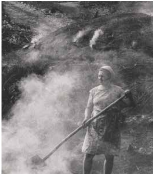
«Charbonniers» ΤΑ ΚΑΡΒΟΥΝΑ