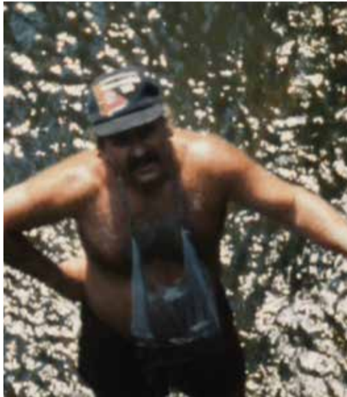
«Un été grec-américain» ΕΛΛΗΝΟΑΜΕΡΙΚΑΝΙΚΟ ΚΑΛΟΚΑΙΡΙ