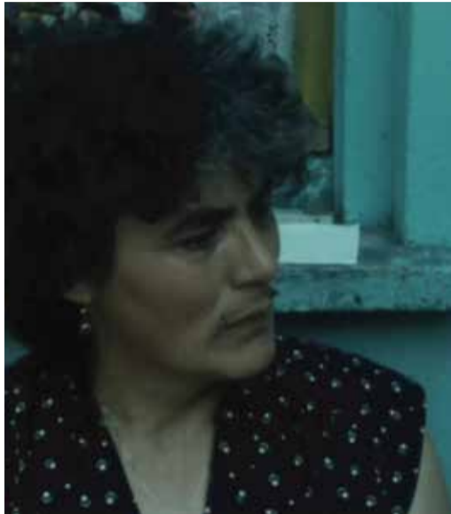
«Quinze ans plus tard, le village...» ΔΕΚΑΠΕΝΤΕ ΧΡΟΝΙΑ ΑΡΓΟΤΕΡΑ